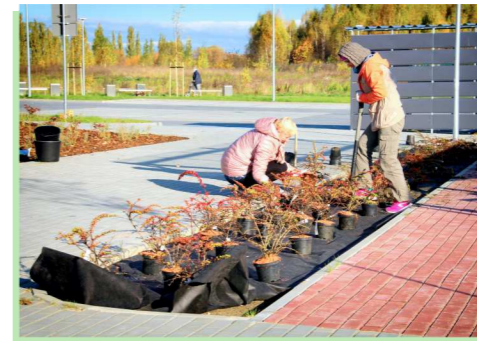
Nasadzenia są w ten sposób komponowane, by były atrakcyjne całym rokiem.

– Jałowce po rozrośnięciu utworzą zimozielony szaroniebieski „dywan” – dodaje pracownica urzędu.