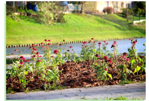
Niezagospodarowane dotąd rabaty w Reckinie obsadzono jeżówkami purpurowymi i różami okrywowymi.