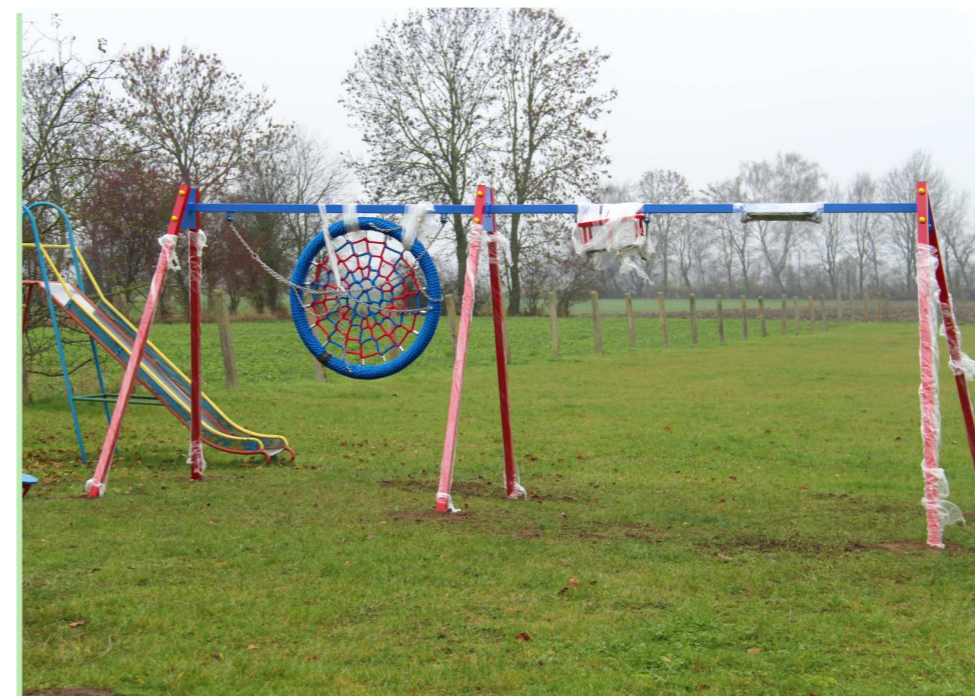
Przy boisku w Łędowie pojawiła się potrójna huśtawka: dwa standardowe siedziska i „bocianie gniazdo”.