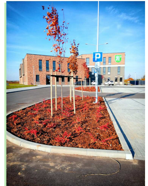
Klony przy nowym budynku Urzędu Gminy Pruszcz Gdański w Juszkowie.