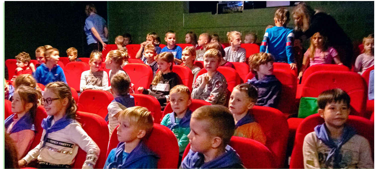
Młoda publiczność miała okazję do obejrzenia najlepszych festiwalowych filmów z różnych zakątków świata.