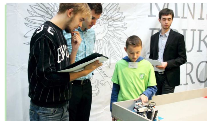
Widzowie otrzymali kupony konkursowe, za pomocą których oceniali film.