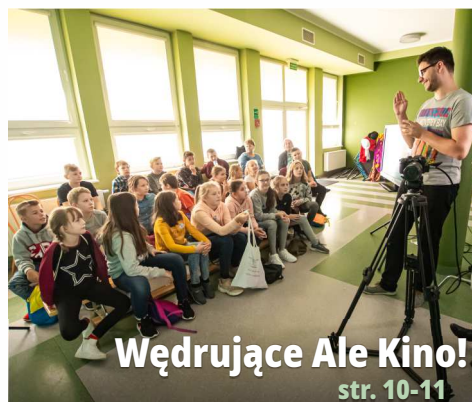
Wędrujące Ale Kino! str. 10-11