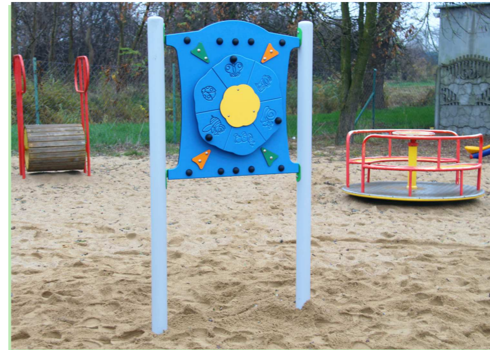
Plac zabawy przy świetlicy w Bystrej (Osiedle) zyskał tablicę edukacyjną „Koło fortuny”.

Bystra Osiedle (plac przy świetlicy) zyskała tablice edukacyjną „Koło fortuny”, Przejazdowo (plac przy ul. Wierzbowej) podciągacz nóg i biegacz, Łęgowo (plac przy ul. Słonecznej) huśtawkę wahadłową podwójną, Świńczę (plac przy świetlicy) dwa sprzęzynowce i podwójny biegacz, Łędowo (okolica boiska) huśtawkę kombinowaną potrójną, Radunica (ul. Podmiejska) tablicę manipulacyjną z zegarem, labiryntem i liczydłem (stara została zdemontowana).