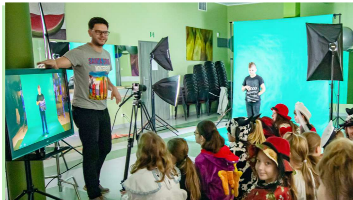
Filmowe warsztaty z wykorzystaniem techniki green screen.