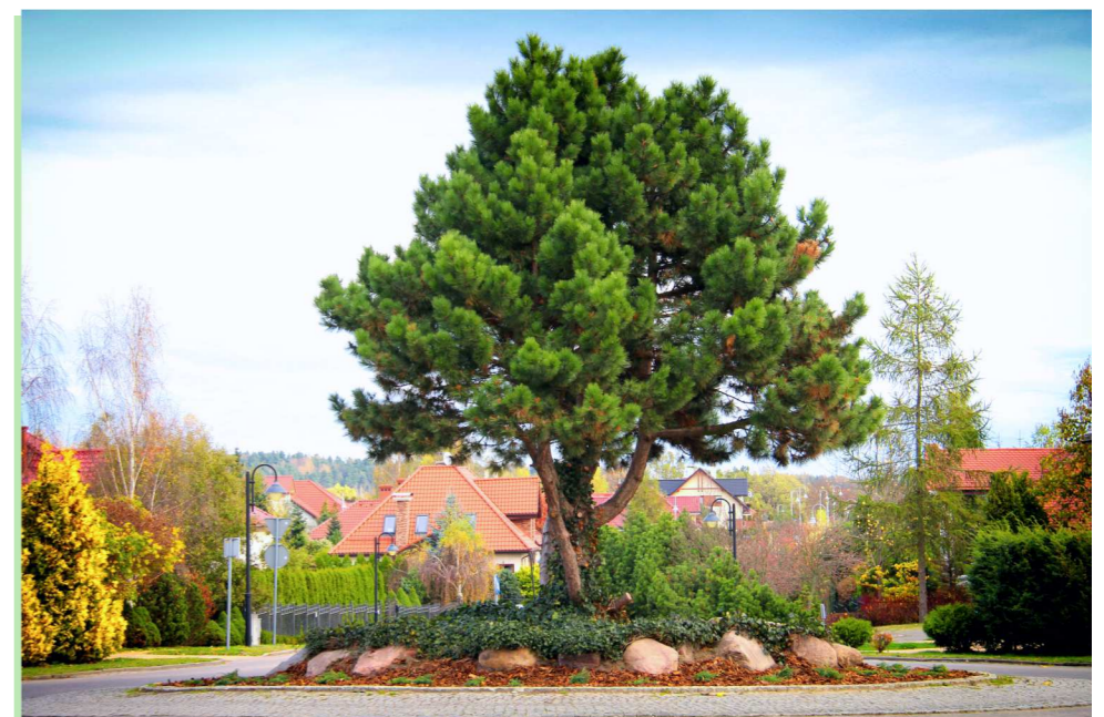
Jałowce utworzą szaroniebieski „dywan” wokół drzewa na rondzie w pasie drogowym ul. Saturna w Straszynie.