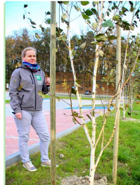
Nad zbiornik w Straszynie zakupiliśmy robinie akacjowe i brzozy.