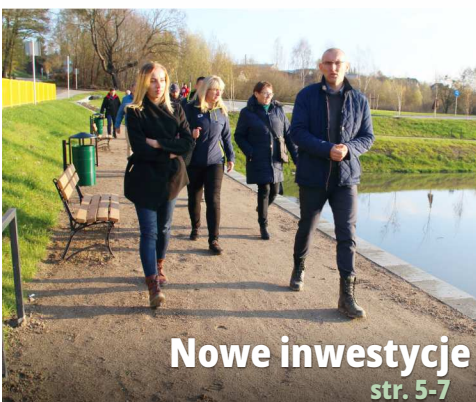
Nowe inwestycje str. 5-7

Tej jesieni posadziliśmy 200 drzew, ponad 500 krzewów i kilka tysięcy cebulek kwiatów.