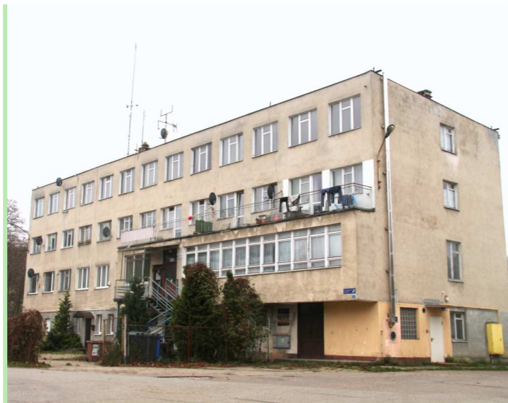
Budynek wielorodzinny przy ulicy Spacerowej 22 w Straszynie zyska nowe oblicze. Wkrótce powstanie projekt jego modernizacji.

Gmina Pruszcz Gdański posiada w swoim zasobie mieszkaniowym 188 lokali o średniej powierzchni 38,69 m 2 . W ciągu ostatnich 5 lat ilość lokali w gminnym zasobie mieszkaniowym zwiększyła się o 28 mieszkań. Około 35% lokali mieszkalnych znajduje się w budynkach wybudowanych w ostatnich 15 latach . Budynki z lokalami mieszkalnymi zlokalizowane są w 13 gminnych miejscowościach .