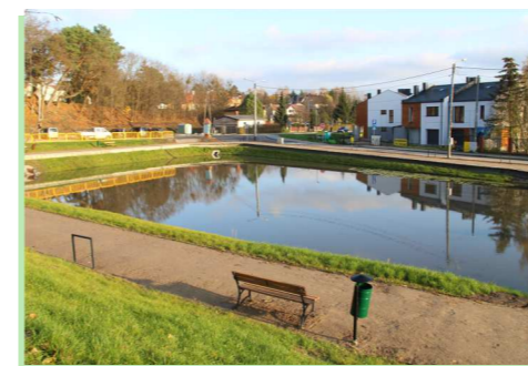
Prace melioracyjne były ważną częścią inwestycji.

Z inwestycji cieszą się zapewne nie tylko kierowcy i piesi, ale również żaby, dla których przy zbiorniku powstał specjalny korytarz. Liczne w tej okolicy płazy, wędrujące w kierunku wody, były dotąd narażone na rozjechanie.