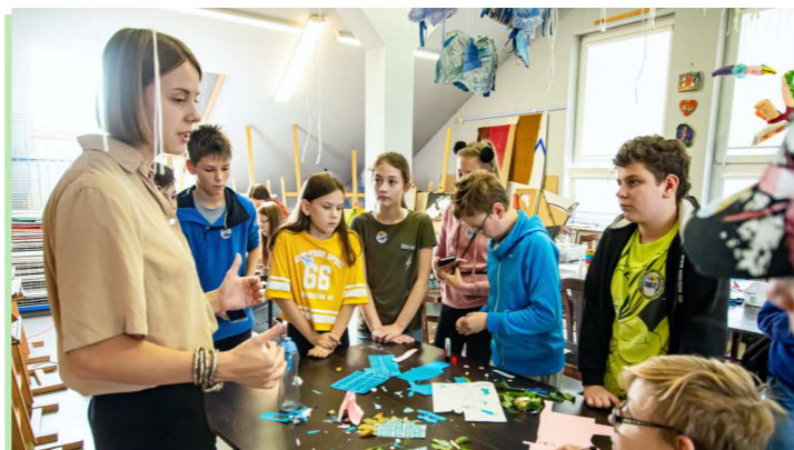
Warsztaty prowadzili animatorzy z Centrum Sztuki Dziecka i Fermant Kolektiv z Poznania.