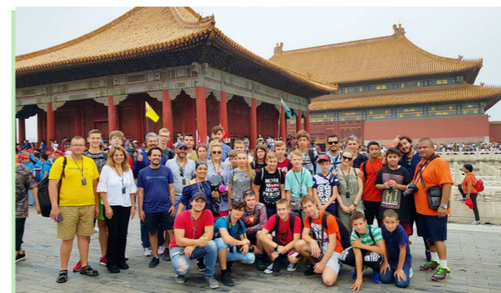
Dzięki konkursów uczniowie zwiedzają świat.