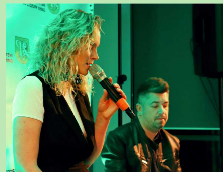
Wieczór uświetnił koncert jazzowy.