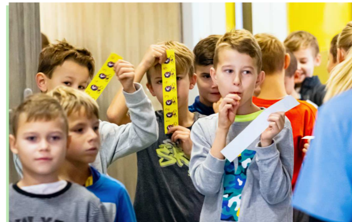
Widzowie otrzymali kupony konkursowe, za pomocą których oceniali film.